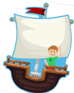
Methodi 1 / 2